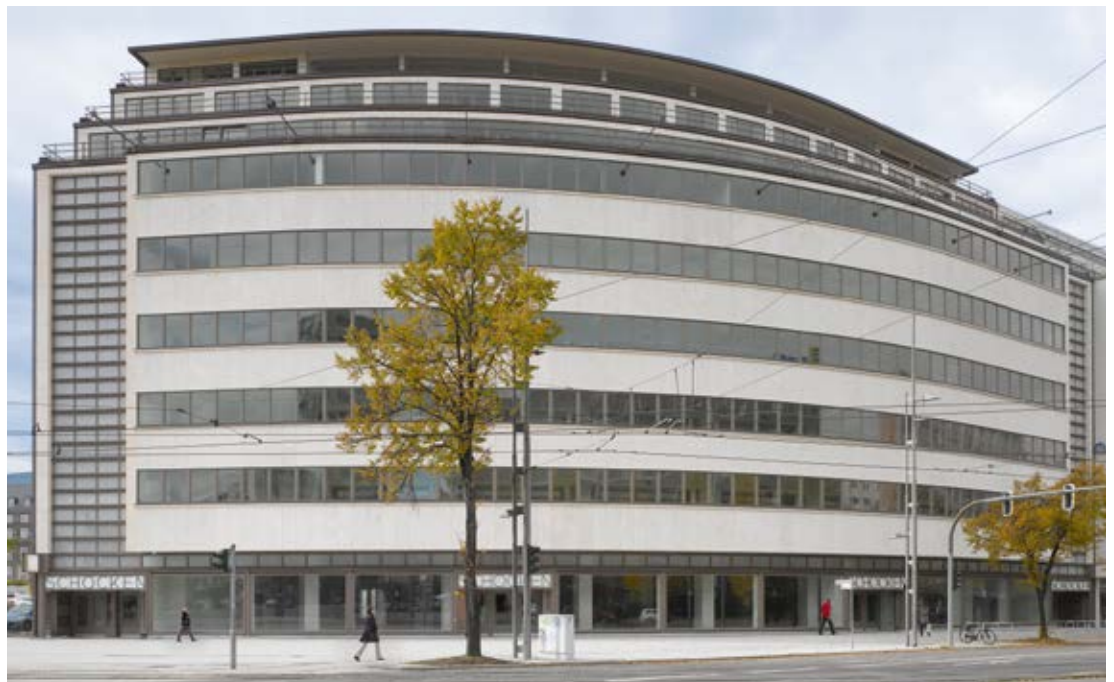
Kaufhaus Schocken, Chemnitz, Deutschland