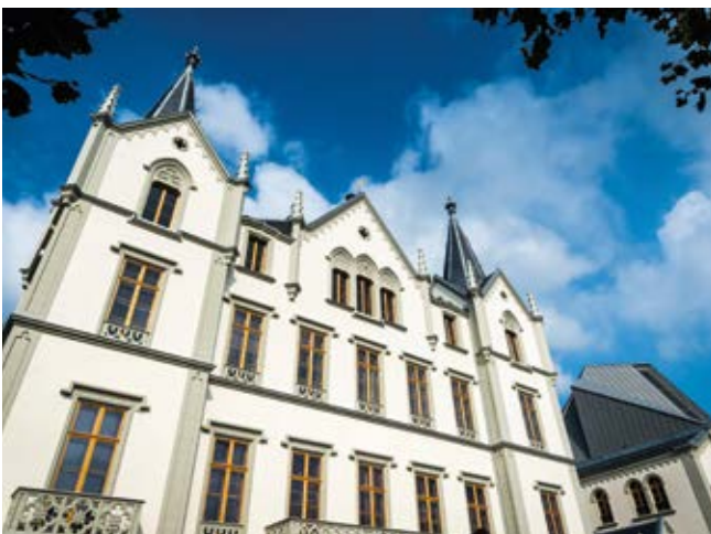
Château de l'Aile, Vevey, Schweiz

GOETHEGLAS ist ein farbloses, gezogenes Glas mit der charaktervollen, unregelmäßigen Oberfläche von Fenstergläsern vor allem des 18. und 19. Jahrhunderts. Es eignet sich auch zur Außenschutzverglasung, um beispielsweise wertvolle Bleiverglasungen vor Umwelt- und Witterungsschäden zu bewahren.