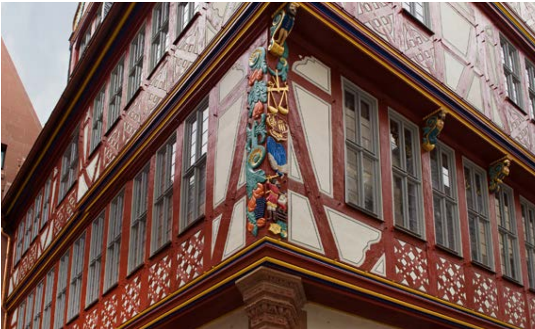
Haus Goldene Waage, Frankfurt am Main, Deutschland

SCHOTT Restaurierungsgläser sind die richtige Wahl zur originalgetreuen Restaurierung historischer Baudenkmäler unterschiedlicher Epochen – mit Glasqualitäten, die in ihrer Anmutung der Ursprungszeit nahekomen: GOETHEGLAS bei Bauten des 18. und 19. Jahrhunderts, RESTOVER® bei Bauten aus der Zeit um 1900 und TIKANA® bei Bauten der klassischen Moderne. Zugleich erschließen die Gläser durch vielfältige Verarbeitungsoptionen höchst zeitgemäße Funktionen – von UV-Schutz bis Wärmedämmung.