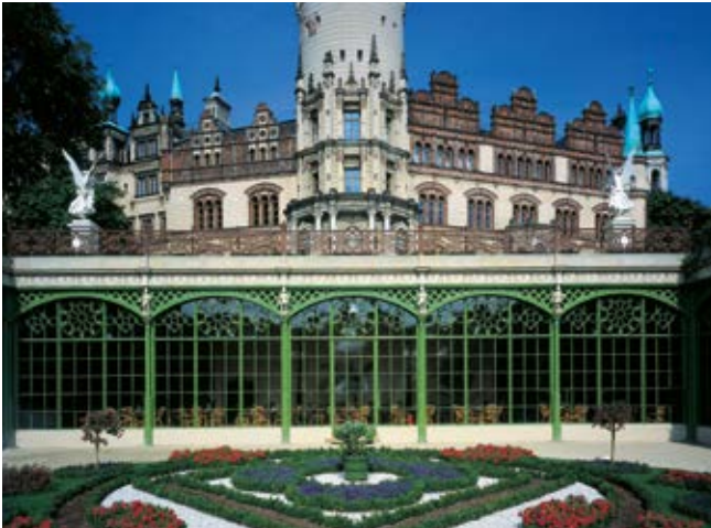
Orangerie Schloss Schwerin, Schwerin, Deutschland