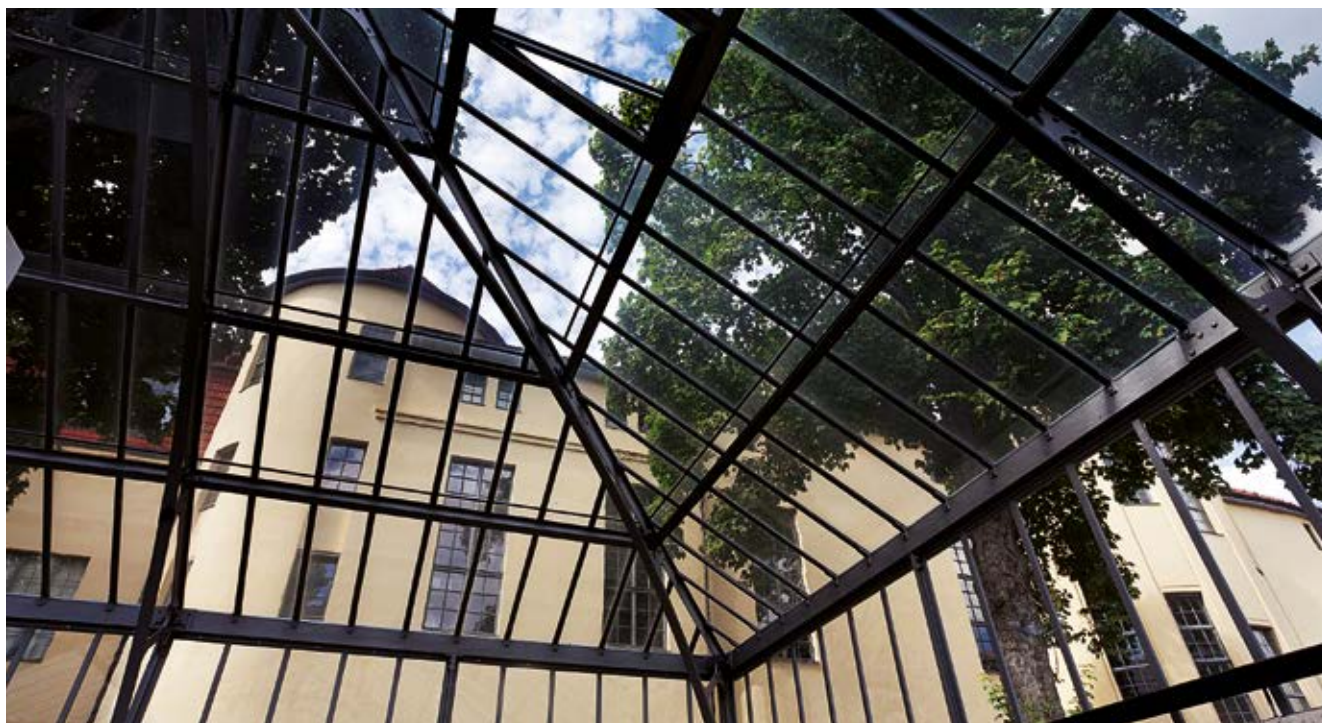
Bauhaus-Universität Weimar – Brendelsches Atelier mit SCHOTT RESTOVER® als Verbundglas