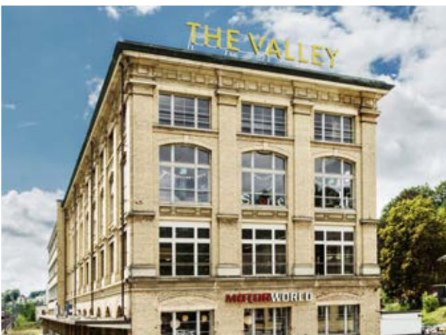
Maggi-Areal, Kemptthal, Schweiz

Mit RESTOVER® light ist zudem eine weniger, mit RESTOVER® plus eine stärker strukturierte, mundgeblasenem Glas ähnelnde Oberflächenvariante verfügbar.